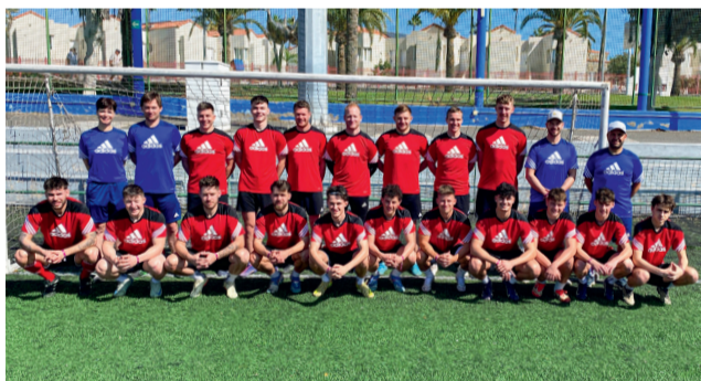
Teamfoto 1. Mannschaft Gran Canaria 2026.